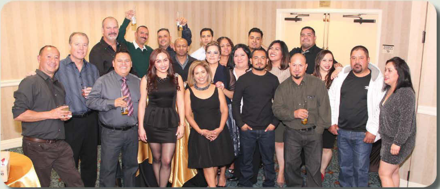
STAFF AND GUESTS gathered to usher in the Holidays last December with festive mariachi, DJ and karaoke music. The Christmas Party was held at the Pasadena Hilton and included great food and gifts for all.